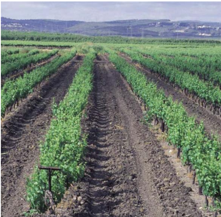
איור 1: הנוף החקלאי בבקעת הנדיב. מתוך מסמך מדיניות "נופי תרבות בישראל", רשות הטבע והגנים, 2011

עיקר המשקים החקלאיים ביישוב ממוקמים בקרקע פרטית. שני אזורים חקלאיים הינם בקרקע מדינה ומאורגנים כאגודות חקלאיות שיתופיות (כאשר הקרקע מוכרת מהמדינה לאגודה החקלאית-שיתופית). כפי שמקובל