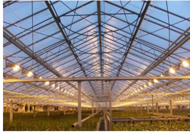
חממה/ בית רשת